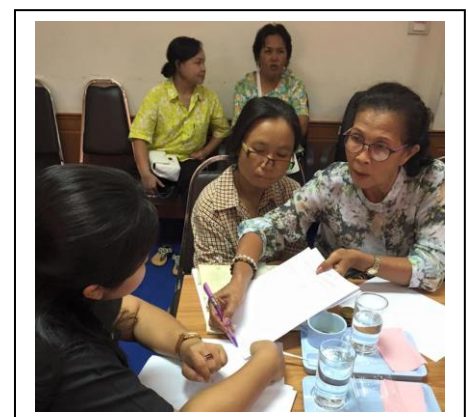
จัดอบรมให้ความรู้ ด้านประวัติศาสตร์ชุมชน / การพัฒนากลุ่มอาชีพ / การพัฒนาสิ่งแวดล้อมชุมชน