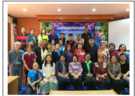
ร่วมกันจัดทำแผนพัฒนาเพื่อแก้ปัญหา และตอบสนองความต้องการของชุมชน