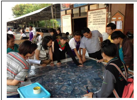
นักศึกษา + อาจารย์ + ชาวบ้าน + เจ้าหน้าที่เทศบาล ลงพื้นที่เก็บข้อมูล ปัญหา ความต้องการของชุมชน