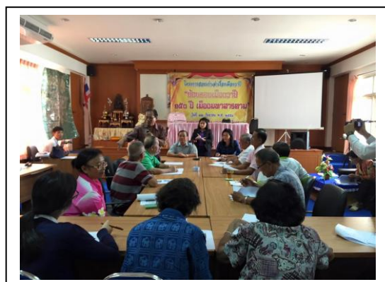
จัดอบรมให้ความรู้ ด้านประวัติศาสตร์ชุมชน / การพัฒนากลุ่มอาชีพ / การพัฒนาสิ่งแวดล้อมชุมชน